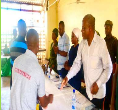
Mkuu wa Wilaya ya Masasi Mhe, Kanoni akigawa zawadi kwa mshindi wa kwanza wa mpira

Katika mchezo wa mpira wa miguu uliochezwa katika Uwanja wa Boma Desemba 9, 2023 Wahuva Sports Club waliibuka kidedea kwa changamoto ya mikwaju ya penati 5-3 dhidi ya Maendeleo Fdc.