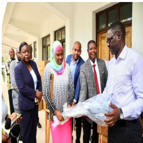
Naibu Waziri Ofisi ya Waziri Mkuu Mhe, Umyy Nderiananga Novemba 22, 2023 apokea na kugawa vifaa saidizi kwa ajili ya watu wenye ulemavu Mkoa wa Mtwara.