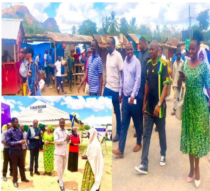
Maandamano ya Kilele cha Kampeni ya siku 16 za kupinga ukatili wa kijinsia Novemba 25-Desemba 10, 2023.

Jarida la Mtandaoni limeandaliwa na, Kitengo cha Mawasiliano Serikalini Halmashauri ya Mji Masasi