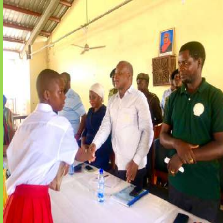
Mkuu wa Wilaya ya Masasi Mhe, Kanoni Desemba 9, 2023 akigawa zawadi kwa mshindi wa kwanza Insha sekondari