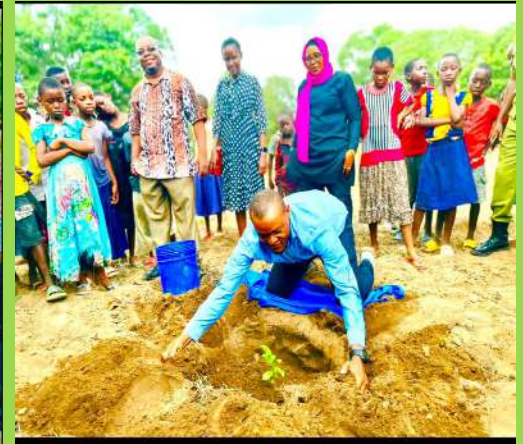
Afisa Tarafa Mji Masasi Fikiri Lukanga akipanda miti katika zoezi la kupanda miti s/m Nangose ikiwa ni shamrashamra za uhuru