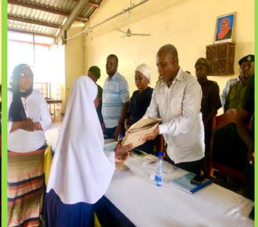
Mkuu wa Wilaya ya Masasi Mhe, Kanoni Desemba 9, 2023 akigawa zawadi kwa mshindi wa Insha shule ya msingi