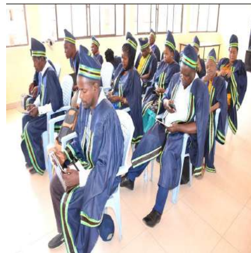
Waheshimiwa Madiwani Halmashauri ya Mji Masasi wakiwa katika Mkutano wa Baraza la Madiwani Novemba 8, 2023.